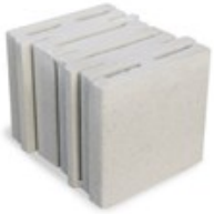
PERLITECH™ TERMICO 30