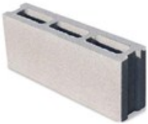
PERLITECH™ TAGLIAFUOCO 8